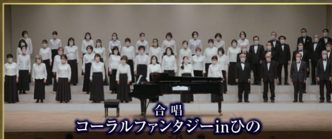
合唱 コーラルファンタジーinひの