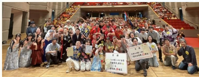
令和7年度 第2回ひの版のど自慢の様子